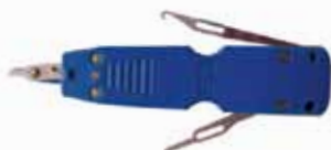
Outil de connexion